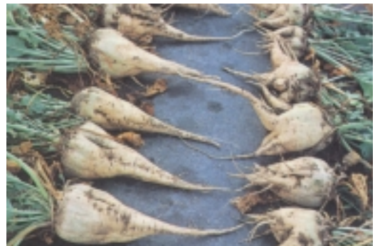
9. Αριστερά τεύτλα που αναπτύχθηκαν σε χωράφι που δέχτηκε υπεδάφιο όργωμα. Δεξιά, τεύτλα από το «μάρτυρα»

Η εφαρμογή της, κάθε 4-5 χρόνια, είναι πολύ ωφέλιμη, στα βαριά κυρίως εδάφη, διευκολύνοντας την συγκράτηση νερού (αραιότερα ποτίσματα) και την ανάπτυξη των ριζών. Επιβάλλεται όμως να γίνεται, πριν το όργωμα με μεγάλους εθικυστήρες σε ξηρό έδαφος με απλό ή σταυρωτό πέρασμα.