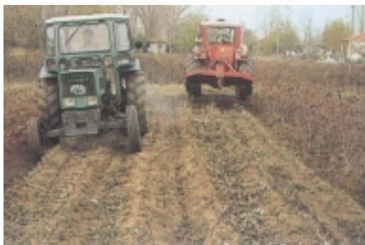
2. Στελεχοκόπτης και όργωμα βαμβακιάς