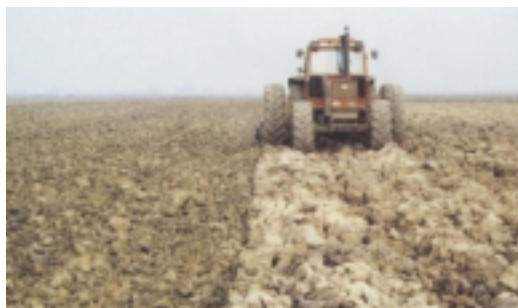
11. Χειμερινό Σβάρνισμα

Όλες οι παραπάνω εργασίες πρέπει να γίνονται όσο το δυνατόν νωρίτερα σε ξηρά χωράφια, για να πετυχαίνουν καλύτερα το στόχο τους και κυρίως να μη συμπιέζουν το έδαφος δημιουργώντας ασφυξία στις επόμενες καλλιέργειες.