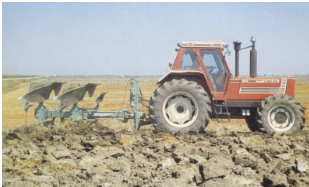
10. Το αναστρεφόμενο άροτρο προστατεύει την ισοπέδωση