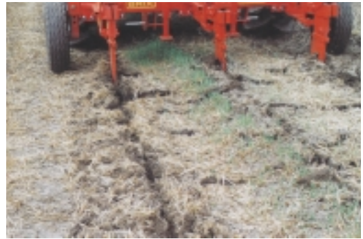
8. Βαθείά Υπεδαφοκαλλιέργεια

Τα απλά φωσφορικά και καθιούχα λιπάσματα, μπορούν να προστεθούν πριν το φθινοπωρινό όργωμα ή σβάρνισμα ώστε μέχρι την άνοιξη να προχωρήσουν στο βάθος που αναπτύσσονται οι περισσότερες ρίζες των τεύτλων.