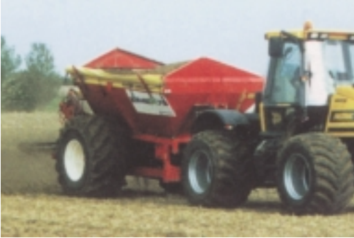
6. Ασβεστοποίηση όξινων εδαφών