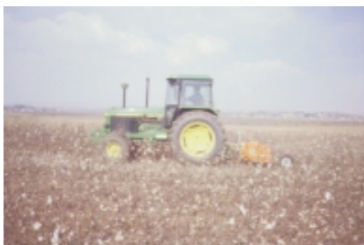
3. Φρεζάρισμα πριν το όργωμα

Πριν το φθινοπωρινό όργωμα, τεμαχίζει και παραχώνει τις ρίζες της προηγούμενης καλλιέργειας (μηδική, καλαμπόκι, βαμβάκι), και είναι χρήσιμο στις περιπτώσεις που δεν έχει ικανοποιητικό αποτέλεσμα μόνο το όργωμα - σβάρνισμα.