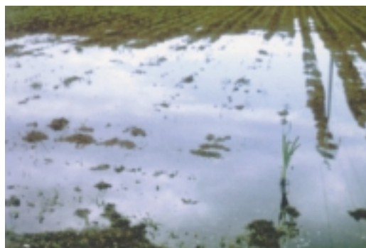
5. Ανεπαρκής ισοπέδωση