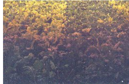
Αριστερά: Ευαίσθητη ποικιλία Δεξιά: Ανθεκτική ποικιλία

Την τελευταία δεκαετία η χρήση ανθεκτικών ποικιλιών , έχει δώσει την δυνατότητα να καλλιεργούνται «μολυσμένα χωράφια» δίνοντας πολύ ικανοποιητικές αποδόσεις. Για την επιλογή της καταλληλότερης ποικιλίας, συμβουλευτείτε τον τοπικό σας Τομεάρχη - Γεωπόνο της ΕΒΖ.