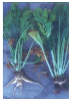
Αριστερά: Πολυριζία (υγιές) Δεξιά: Ριζομανία (άρρωστο)