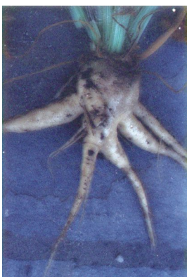
Πολυριζία (υγιές τεύτλο)

Στην Πολυριζία τα τεύτλα είναι άσπρα τόσο εξωτερικά όσο και σε τομή τους και επί πλέον δεν παρουσιάζουν τα χαρακτηριστικά άφθονα ριζίδια. Αντίθετα στη Ριζομανία οι διχλωτές ρίζες της Πολυριζίας εμφανίζουν τα χαρακτηριστικά συμπτώματα της ασθένειας στις πλάγιες ρίζες.